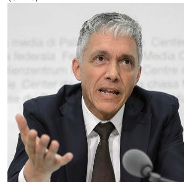
Michael Lauber, Schweizer Bundesanwalt