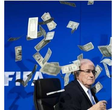
Sepp Blatter

« The real reason for applauding the Swiss authorities' action was, of course, that it suggested inquiries are reaching right into the putrid core of Fifa's power structure » ( Sunday Times, UK )