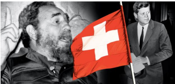
Das Schweizer Schutzmandat in Kuba

Im Zusammenhang mit der Wiederaufnahme der diplomatischen Beziehungen zwischen Kuba und den USA wird in ausländischen Medien über das Ende des Schweizer Schutzmandats berichtet (p.ex. Foreign Policy ). Obwohl eher die Wiedereröffnung der beiden Botschaften im Rampenlicht stand, führten auch die Mediationsaktivitäten der Schweiz zu ausführlichen Hintergrundartikeln. Dies führte auch dazu, dass die Guten Dienste der Schweiz in der internationalen Presse hervorgehoben wurden.