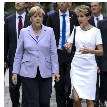
Treffen zwischen Simonetta Sommaruga und Angela Merkel

« Switzerland offers Europe lessons on handling asylum seekers » (Reuters)