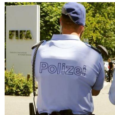
FIFA: Auslieferungsgesuch der USA

das Strafverfahren des Schweizer Bundesanwalts. Zwar wird nicht ausführlich auf die Rolle der Bundesanwaltschaft eingegangen, die Schweiz erscheint trotzdem als aktive Akteurin, die sich um eine Regulierung intransparenter FIFA-Praktiken bemüht.