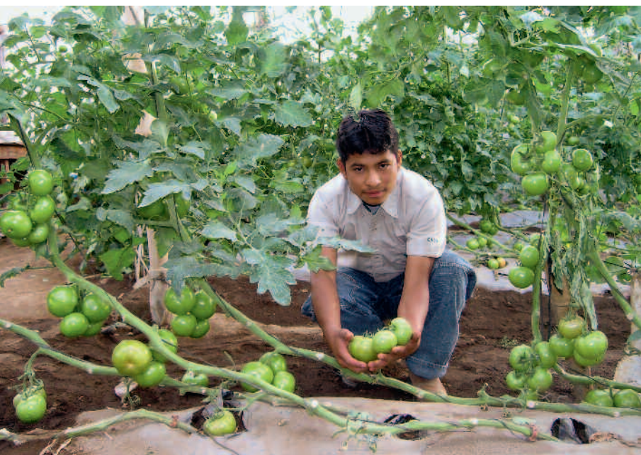
Bettina Jenny/Helvetas Swiss Intercooperation