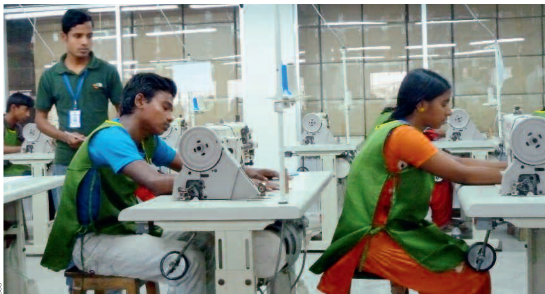
L'industria del cuoio in Bangladesh ha sviluppato un proprio modello di formazione professionale, visto che quello offerto dallo Stato era lacunoso.

Confrontata con un'annosa mancanza di manodopera qualificata, l'industria del cuoio del Bangladesh intende colmare questa lacuna promuovendo una propria formazione professionale. Con il sostegno della Svizzera sta testando un sistema di tirocinio in impresa, un modello inedito nel Paese, ma che ha dato risultati molto incoraggianti.