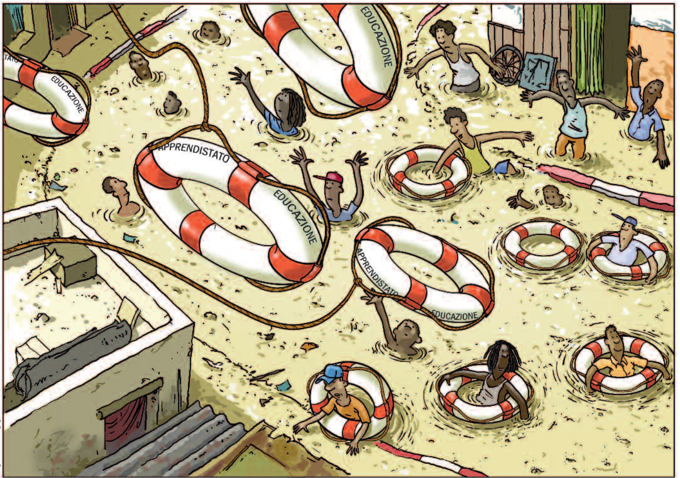
Disegno di Jean-Augustin