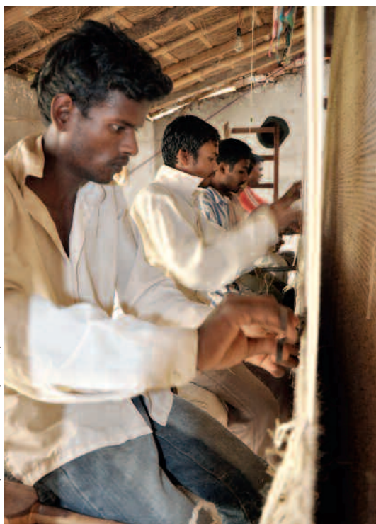
Bettina Jenny/Helvetas Swiss Intercoperation (2)