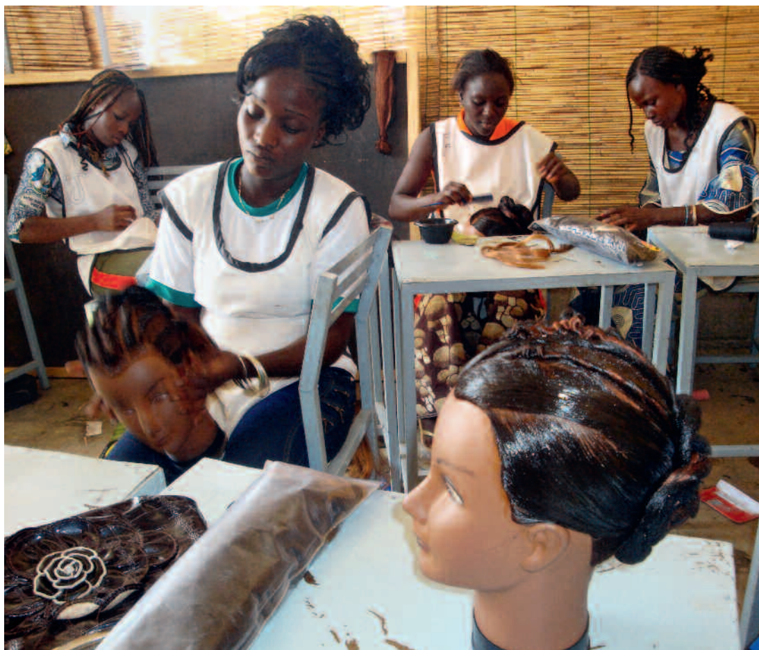
In Burkina Faso, il progetto iniziato nel 2006 e volto a migliorare l'organizzazione e la formazione professionale dà i primi frutti. I giovani diplomati trovano con una certa facilità un buon posto di lavoro oppure diventano liberi professionisti.

entro il 2014 il numero dei giovani in formazione sarà raddoppiato. Per ora, lo Stato ha riconosciuto dieci percorsi modello delle 110 professioni artigianali presenti in Burkina Faso. Senza questi documenti, che ufficializzano gli obiettivi della formazione, l'istruzione non può iniziare. Gli artigiani stanno perciò elaborando altri moduli, in particolare per gli impianti idraulici e la tessitura, che dovranno essere approvati dallo Stato. Si prevede che entro il 2016 saranno disponibili una ventina di iter formativi.