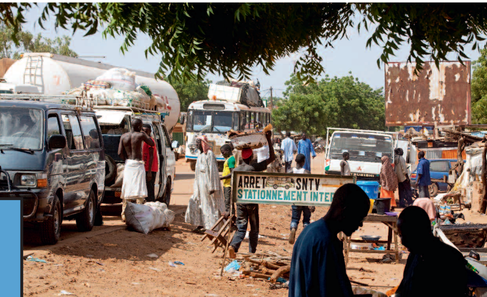
Niamey è il centro politico, culturale ed economico del Paese e meta per gli immigrati.