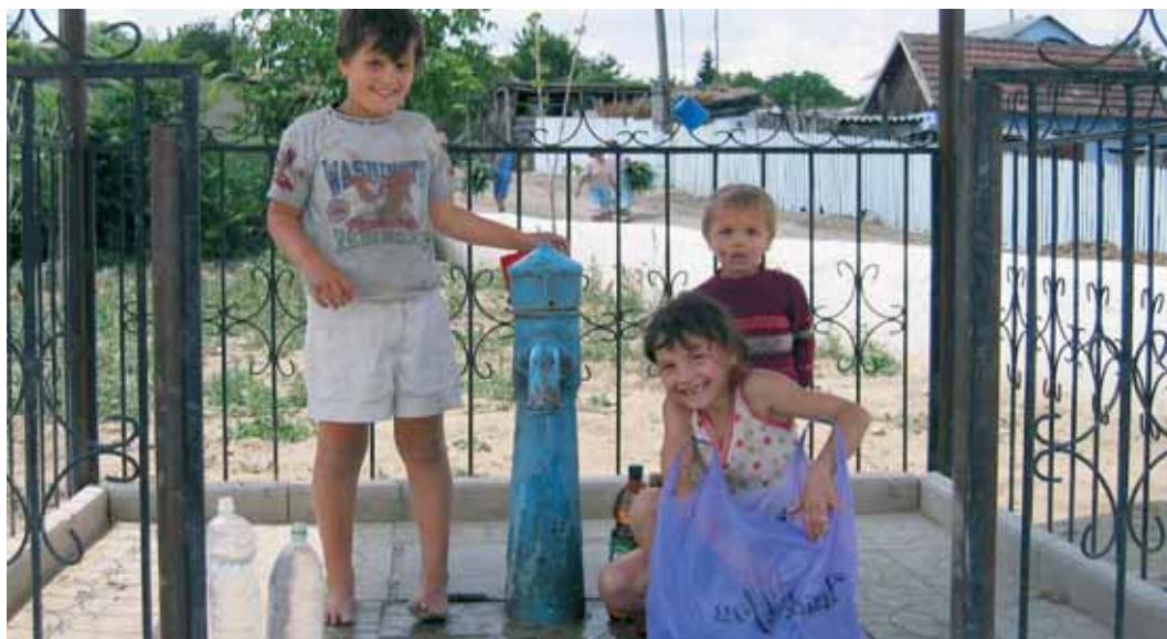
Station d'eau en Moldavie

Autour des programmes se développe un secteur privé formé d'entreprises de plus en plus compétitives. Les investissements dans les