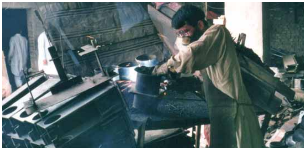
Production de pompes manuelles dans un atelier artisanal, Inde.

Les mesures de régulation des conflits se sont jusqu'ici également avérées efficaces au Niger. Grâce à de nouvelles procédures de