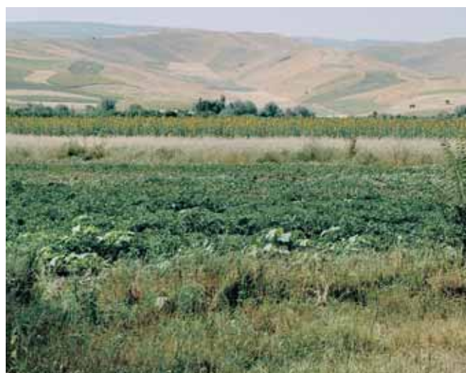
Vallée de Fergana: survie de l'agriculture grâce à l'irrigation