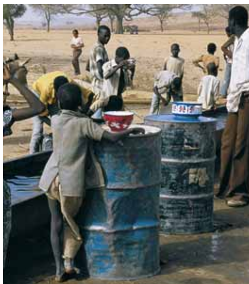
Puits au Niger

En Moldavie, le taux d'hépatite A a reculé. Cet effet positif lié à l'amélioration de l'approvisionnement en eau a cependant été neu-