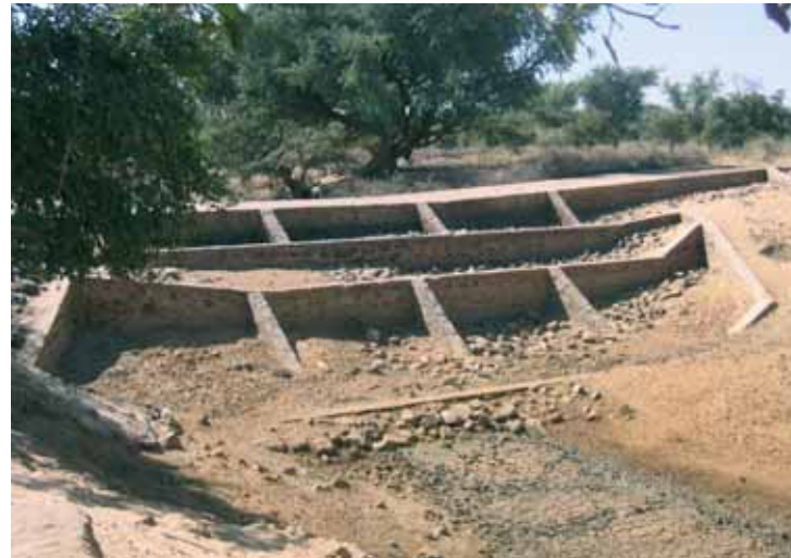
Province de Téra (Niger): aménagement de seuils d'épandage dans le fleuve