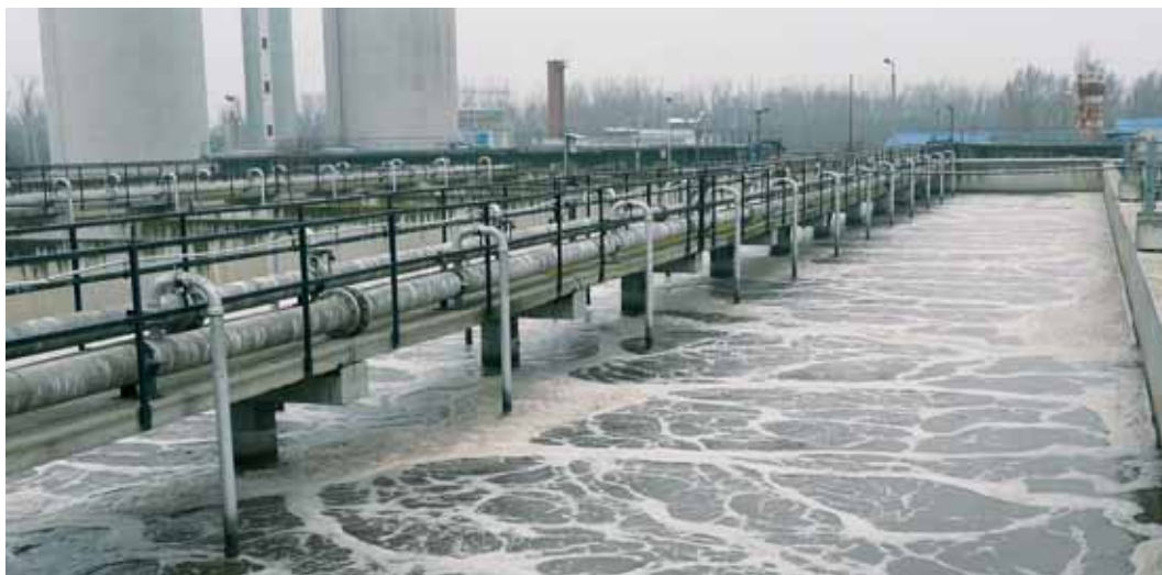
Station d'épuration des eaux à Debrecen, Hongrie

conflits liés à l'eau ont contribué à prévenir des crises.