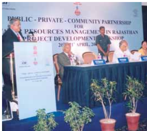
Création d'un partenariat public-privé en Inde.

Des succès ont été remportés dans le dialogue politique aussi. Sur proposition du Partenariat mondial de l'eau (PME) par exemple, des ministères des ressources naturelles et de l'environnement ont été créés en Thaïlande,