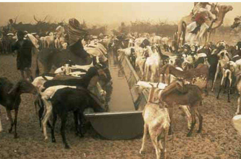
Abreuvoirs à bétail près d'une pompe au Niger