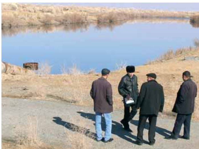
Bassin de décantation à 30 km de Nukus