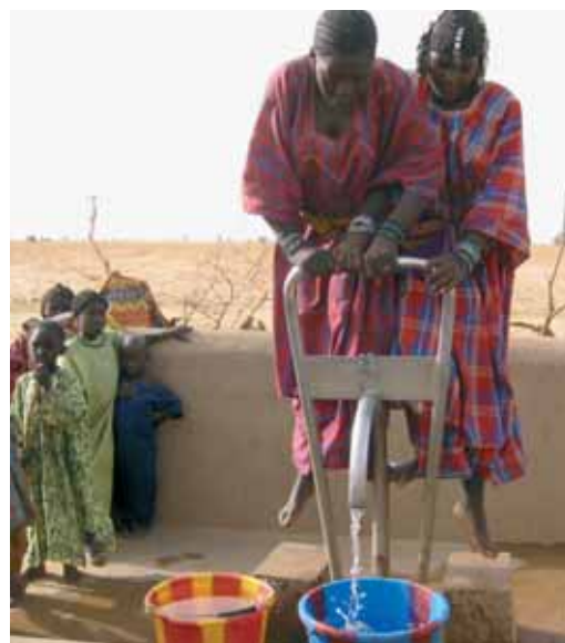
Femmes et enfants: les premiers bénéficiaires

L'augmentation de la production est relativement simple à chiffrer. Les autres effets qui en découlent (comme une meilleure résolution des conflits) n'ont pas été pris en compte dans cette analyse.