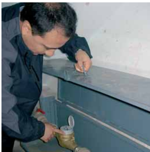
Khujand: les compteurs d'eau sont importants pour garantir l'égalité de traitement des consommateurs et leur disposition à payer leurs factures.

Tous les projets examinés ont des effets positifs sur les conditions cadres: impulsions économiques, gestion de conflits, protection de l'environnement, renforcement des entreprises d'approvisionnement et d'évacuation des eaux et bonne gouvernance.