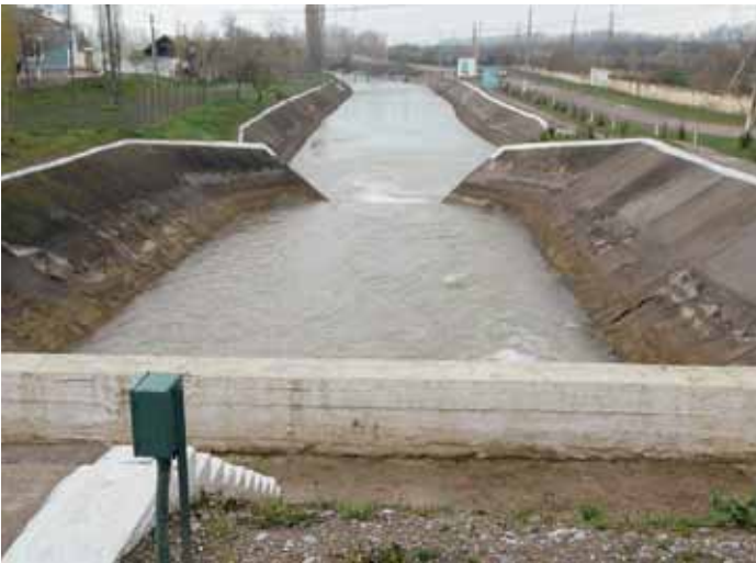
Canal principal d'irrigation dans la vallée de Fergana, Asie centrale

Ces travaux ont mis en évidence le fait que dans les projets soutenus par la Suisse, le relevé des données sur l'accès à l'eau et sur l'efficacité des mesures prises devait être amélioré.